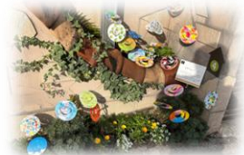
↑なづなまちかど↓ ミュージアムの作品

東山区社会福祉協議会では、令和7年10月20日(月)～11月19日(水)に、東山区役所健康長寿推進課と共催で、区内の福祉にまつわるアートイベントやカフェなどを巡るスタンプラリーを開催しました。