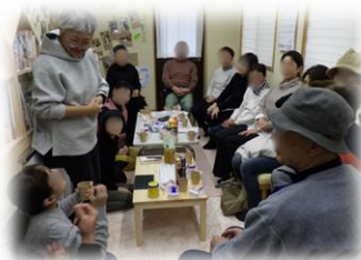
「お試し企画」実施時の様子

今後は、コミュニケーションを通じて気軽に手話を実践できる身近な地域の居場所を目指しています。そして当