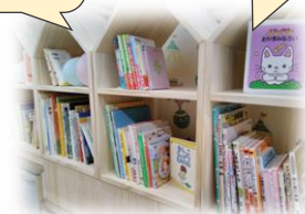
子ども向けの図書が たくさんあります!