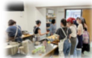
「ふれあい食堂」 当日の様子

東山区にて先駆的に取り組まれている協立スクールさん。今後の活動の展開にもますます注目です！