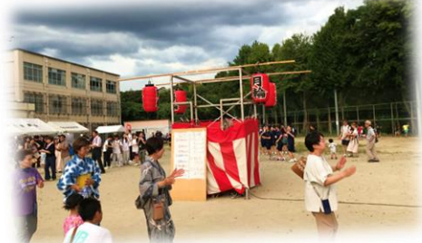
8月24日(土)月輪まつり2024 学区社協では、ポップコーンを販売。 みんなで長生き音頭も踊りました♪