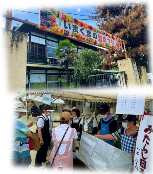
7月28日(日)いまくまの夏まつり 学区社協では、みたらし団子を売りました。 なんと売り切れ！大盛況でした。

夏の暑さも少し落ち着き、秋を感じる瞬間も増えてきました。みなさまいかがお過ごしでしょうか。今年度2号目となる「ひがしやまpetit」8月号では、東山区内で実施された多様な「夏らしい」取組を中心にみなさまへお届けしていきます。まずは各学区の夏祭りの様子から！