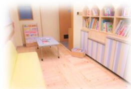
木目のタイルで 過ごしやすい雰囲気

東山区社会福祉協議会では、誰でも立ち寄れる地域の図書館「ひだまり図書館」を開所しています！こちらは、東山区まちじゅう図書館プロジェクトの一環として、昨年7月に開設。月～木曜日の9時～17時は自由にご利用いただけます。