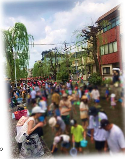
8月4日(日)白川あわた夏祭り 子どもたちが白川に入って、 放流したお魚すくいを楽しみました。